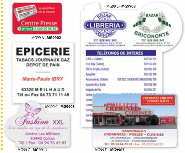
MG99 A - MG9902