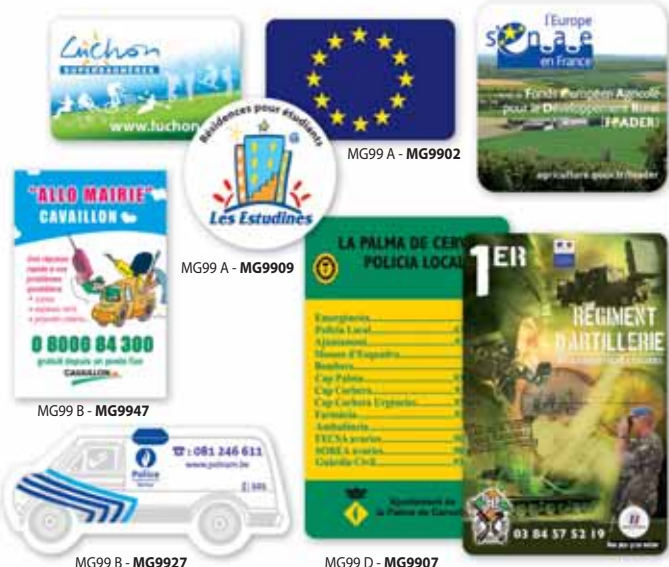
MG99 B - MG9964