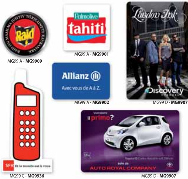
MG99 A - MG9909