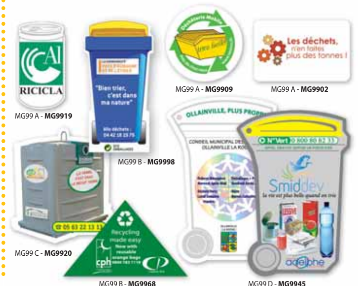
MG99 A - MG9919