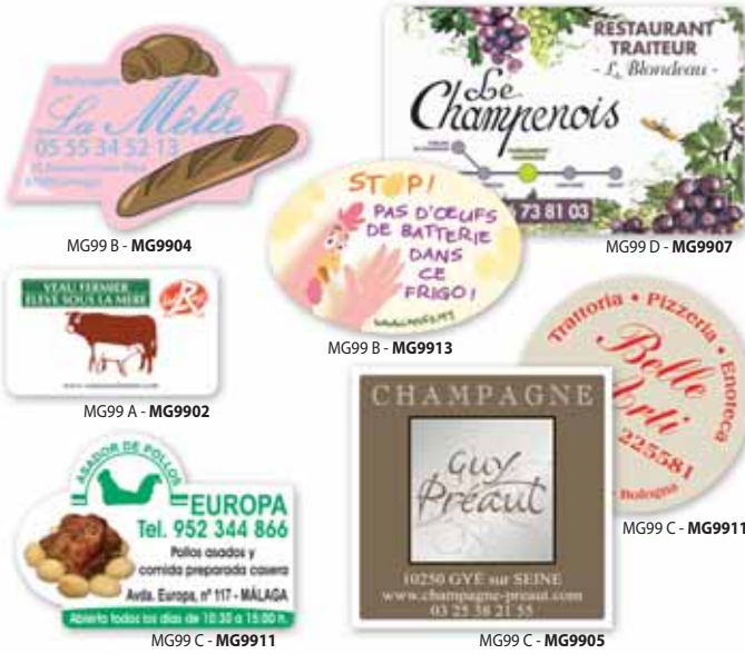
MG99 B - MG9904