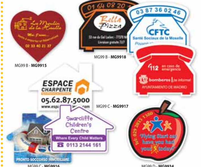
MG99 B - MG9915