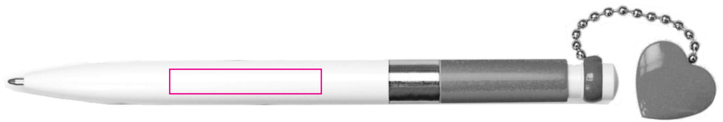
40 X 6,5 mm Tampographie / Padprinting / Tampografia / Tampografía