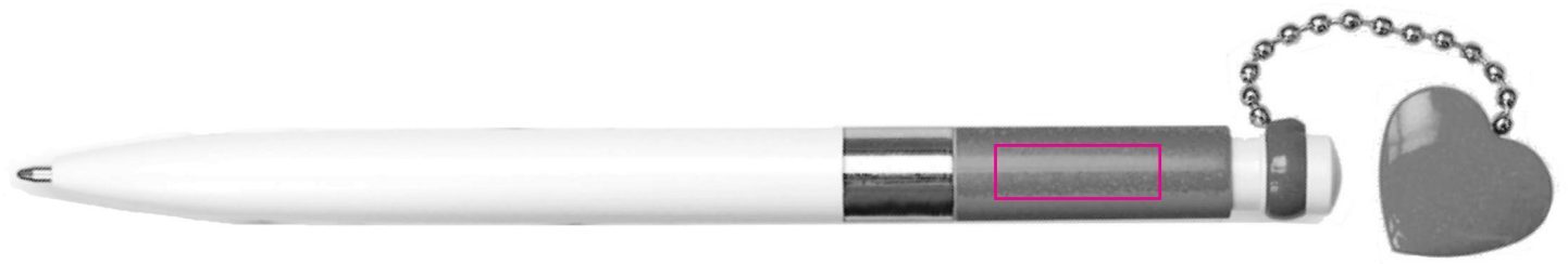
20 X 6,5 mm Tampographie / Padprinting / Tampografia / Tampografía